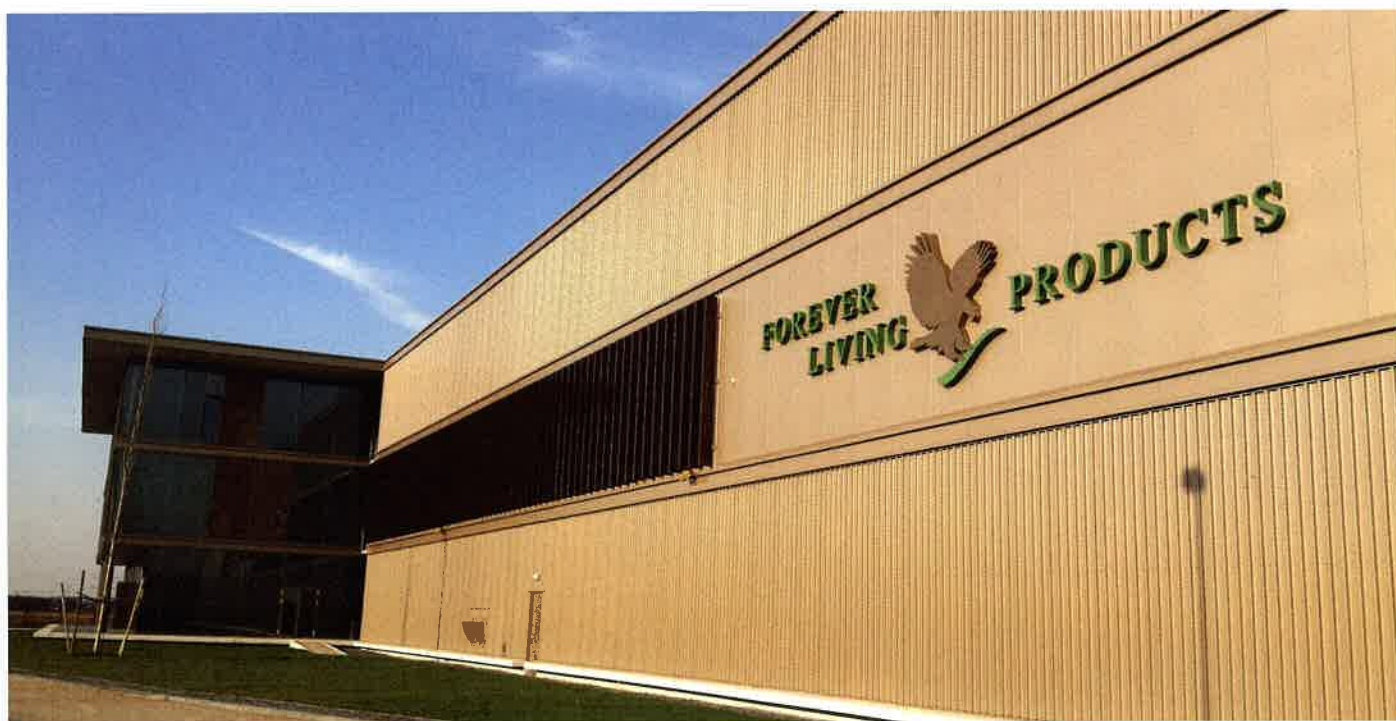
Finaal zal Forever Direct vanuit het centrale dc de distributeurs in 18 landen rechtstreeks bedienen.

tiesites en de bulkvolumes die nog steeds verstuurd zullen worden naar de overblijvende nationale magazijnen in EMEA.