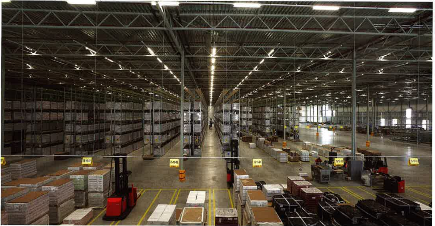
Ongeveer de helft van het nieuwe magazijn is gereserveerd voor de bulkvoorraad. In de palletstellingen is plaats voor 8.500 locaties. Vanuit dit gedeelte wordt in de eerste plaats de voorraad in de lokale magazijnen aangevuld.