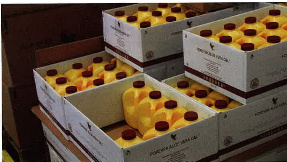
Voor de verzameling van snellopers is langs het conveyortraject een aparte zone voorzien, waar producten van pallets op een doorrolsysteem in de verzendoos worden verzameld.